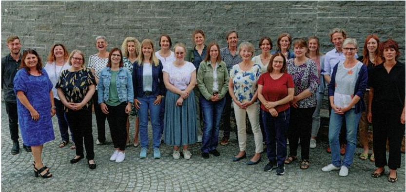
Mitglieder der Kinderlobby Liechtenstein

ausgetauscht, Termine koordiniert und abgemacht und neue Organisationen vorgestellt und aufgenommen.