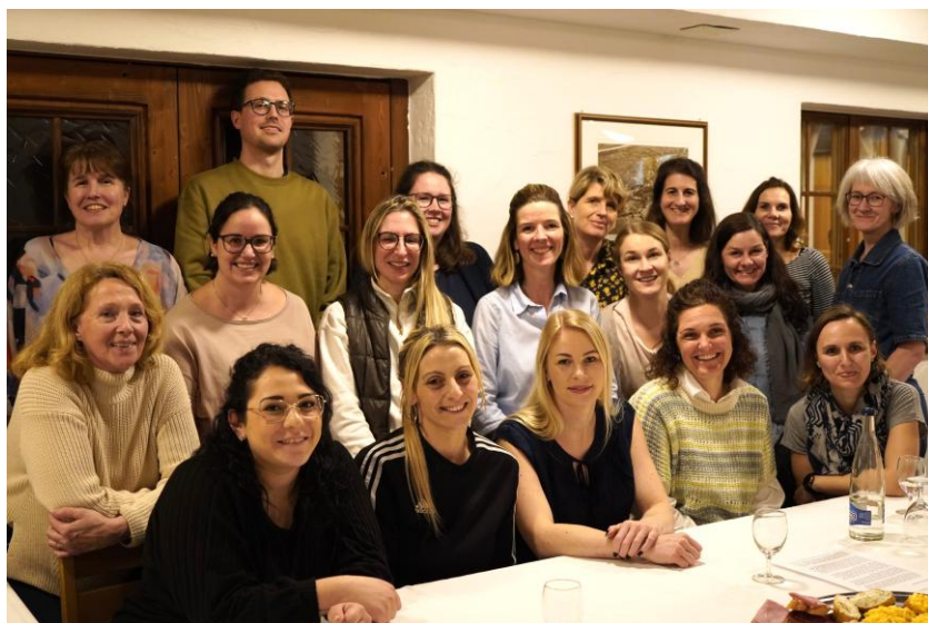
Mitglieder an der Generalhauptversammlung 2024